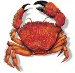
Cangrejo: come algas y animales muertos; pone huevos