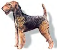
Perro: se alimenta de carne y de vegetales; pare a sus cachorros