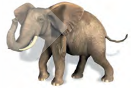
Elefante: se alimenta de plantas; pare a sus crías