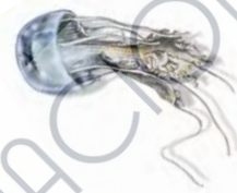
Medusa: caza y devora pequeños animales; pone huevos