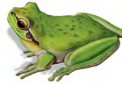
Rana: caza y devora pequeños animales; pone huevos