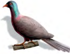
Paloma: come hojas, frutos y semillas; pone huevos