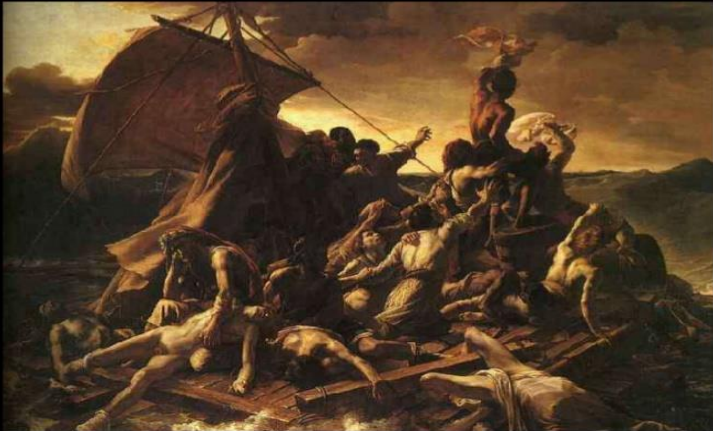
LA Balsa de Medusa (1818-19)

La obra La Balsa de la Medusa se convierte en un alegato político contra la pasividad del gobierno, cuya incompetencia provoca el naufragio de la fragata Medusa.