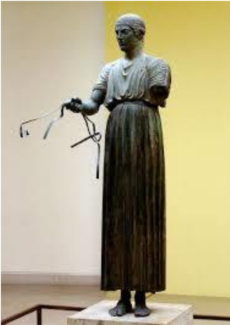
EL AURIGA DE DELFOS