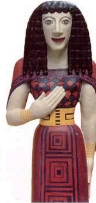
La dama de Auxerre, Museo del Louvre de París, c. 630-600 a. C. Según Richter (1990)