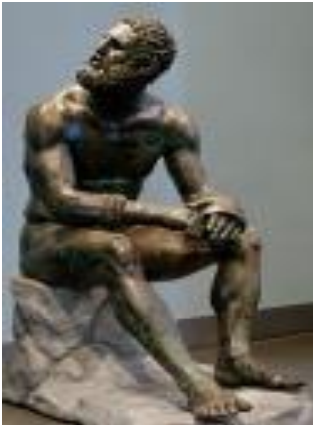
El púgil en reposos