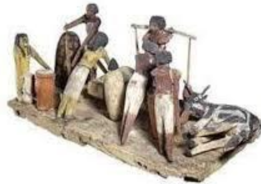
Oushebti de agricultores y ganaderos